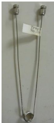
低温濃縮 有機ガストラップ