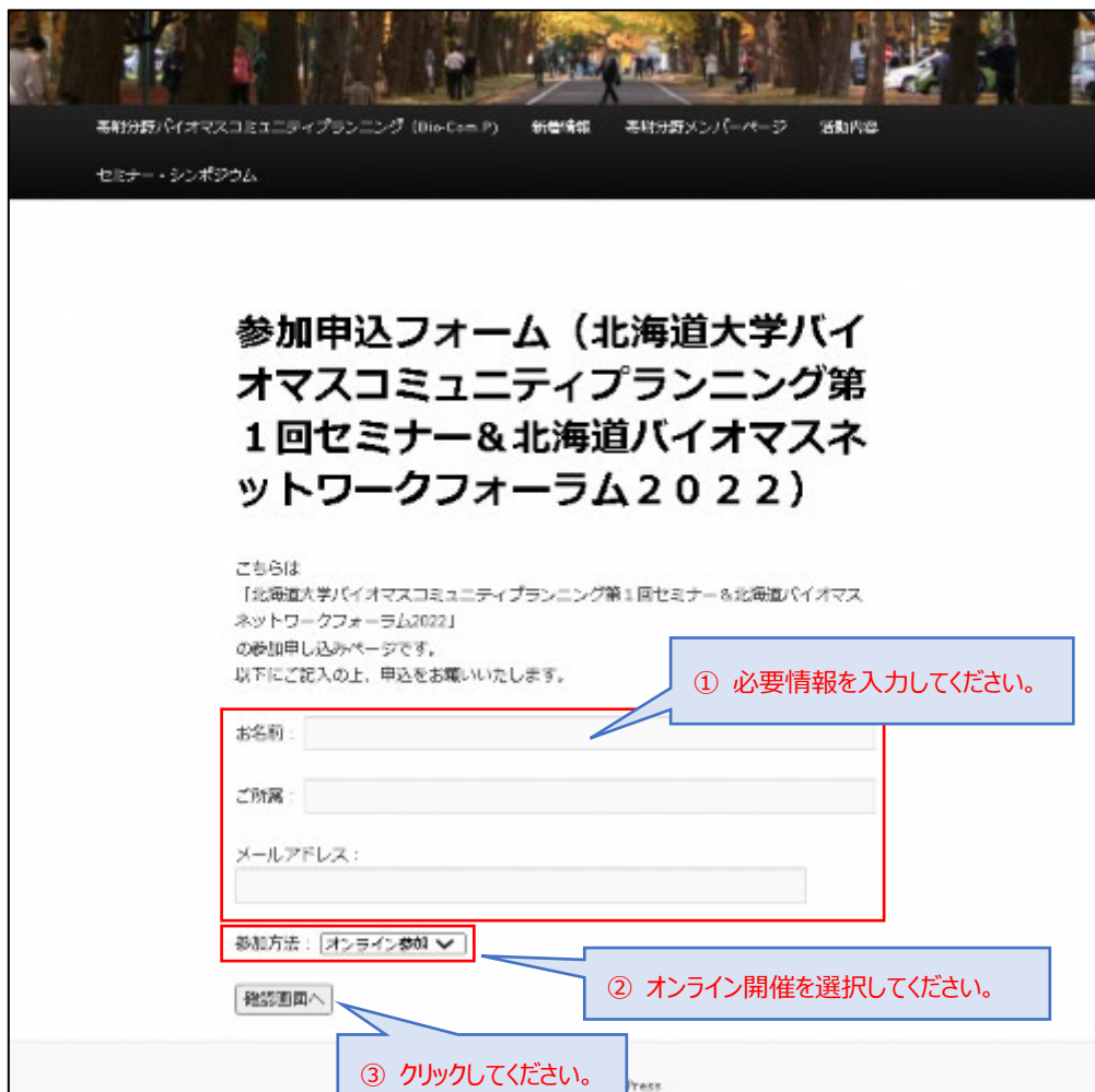
図 1. 参加お申し込みのページ